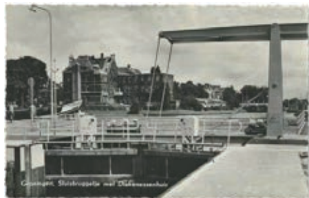
Rechts: sluis bij de zuiderhaven.

Nu de 'drukke' Aa-weg oversteken, nog tweehonderd meter tot de kleuterschool aan de Westerbinnensingel. Het is een oud gebouw, uit 1892 als 'bewaarschool' gebouwd, kleuterschool dus. Het ziet er een beetje uit als een kerk, met mooie kleurrijke mozaïken aan de muur. Daar hadden toen al Zwitsers de vingers in het spel: de bewaarschool werd volgens de voorstellingen van de Zwitserse pädagoog Wilhelm Fröbel ingericht. Daar-