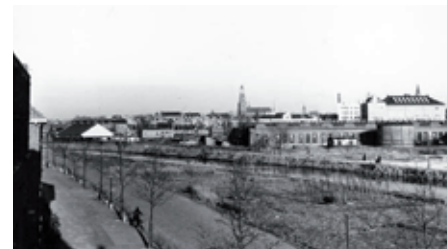
Het Zwarteweggetje, rechts van het Hoornsediep in Groningen, 1958

Ik bibber ervan en ren aan het dok voorbij! Een paar meter verder is de