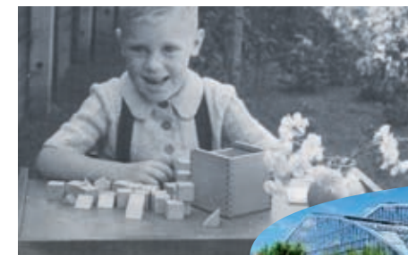
Met de blokkendoos op de kleuterschool

Er blijft mij niets anders over dan terug te gaan en aan te bellen... □